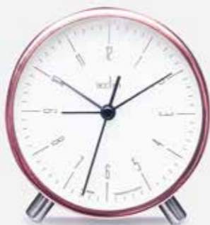
Žadintuvas | C&D STYLE | 24 €