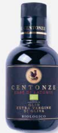
Alyvuogių aliejus | LIVINN sveiki produktai | 9,32 €