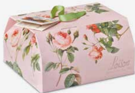
Itališkas pyragas | BOTTLELY | 23 €