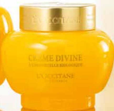
Šlamučio veido kremas „Divine“, 30 ml