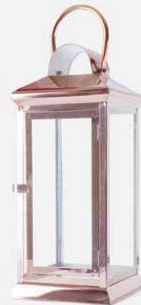
Žibintas | C&D STYLE | 50 €