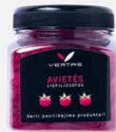
Liofilizuotos avietės LIVINN sveiki produktai | 2,22 €