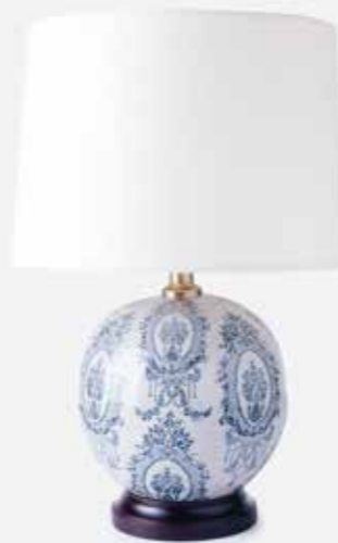
Šviestuvus | IMDECO | 100 €