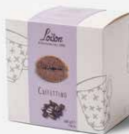
Itališki sausainiai | BOTTLELY | 6 €