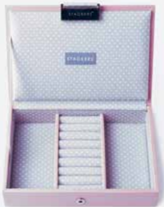
Papuošalų dėžutė | IMDECO | 32 €