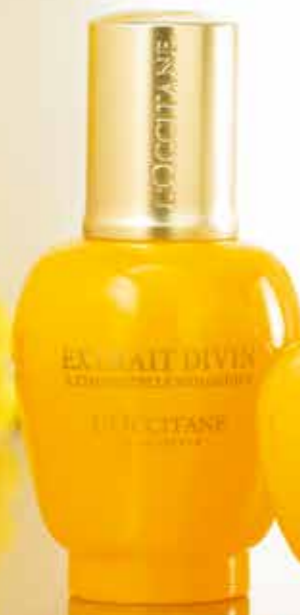
Šlamučio veido ekstraktas „Divine“, 30 ml

ODA ATRODO JAUNESNĖ 85% MOTERŲ 5 REGISTRUOTI PATENTAI