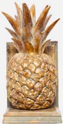
Knygų atrama | IMDECO | 34 €