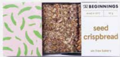
Sėklų trapučiai | LIVINN sveiki produktai | 3,99 €