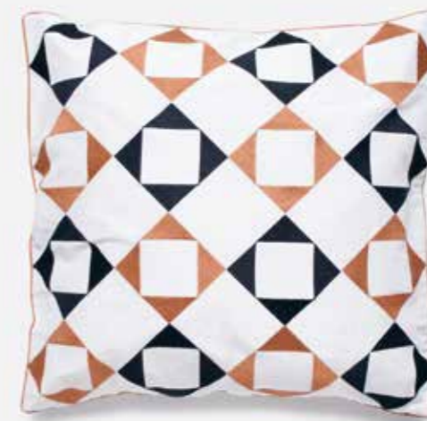
Pagalvėlė | C&D STYLE | 80 €