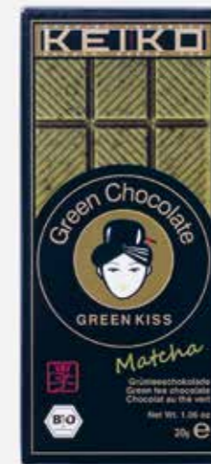
Ekologiškas šokoladas | LIVINN sveiki produktai | 2,30 €