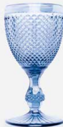
Taurė | C&D STYLE | 12 €