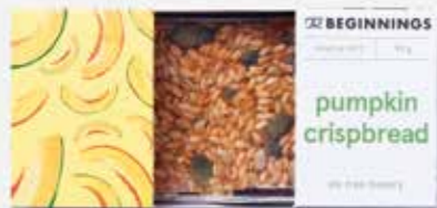
Moliūgų trapučiai | LIVINN sveiki produktai | 3,65 €