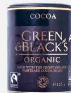
Ekologiška kakava | LIVINN sveiki produktai | 5,41 €