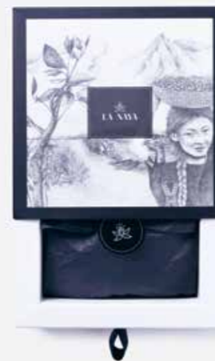
Džiovinti juodieji serbentai juodajame šokolade LIVINN sveiki produktai | 9,94 €