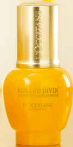
Šlamučio paakių kremas „Divine“, 15 ml

Vilniuje: PC „Europa“, I a., Gedinimo pr. 33; PC „Panorama“; Kaune: Laisvės pl. 45; PC „Hyper Maxima“; PC „Akropolis“; Klaipėdoje: PC „Akropolis“; Šiauliuose: PC „Akropolis“; Panevėžyje: PC „RYO“