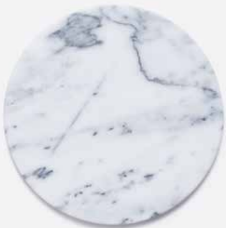
Marmurinis padėklas | METALO AMŽIUS | 16,77 €